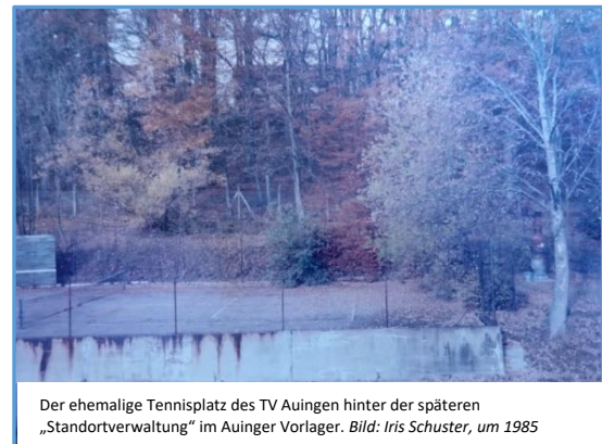
Der ehemalige Tennisplatz des TV Auingen hinter der späteren „Standortverwaltung“ im Auinger Vorlager. um 1985